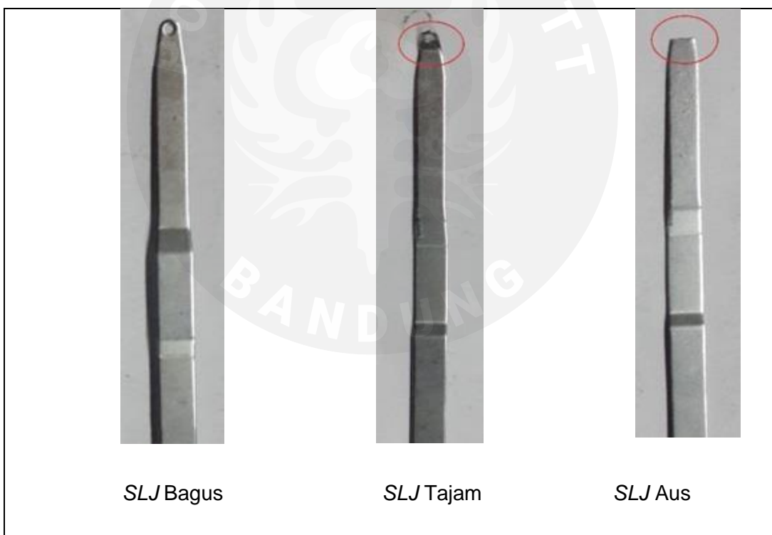
Lampiran 4 Perbedaan gambar SLJ yang bagus dengan SLJ yang sudah tajam dan aus