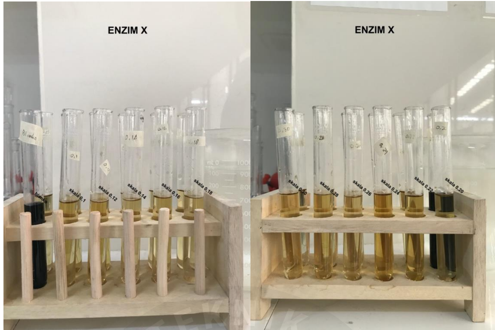
Lampiran 1 Hasil pengujian aktivitas enzim X