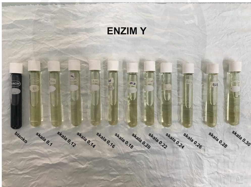
Lampiran 2 Hasil pengujian aktivitas enzim Y