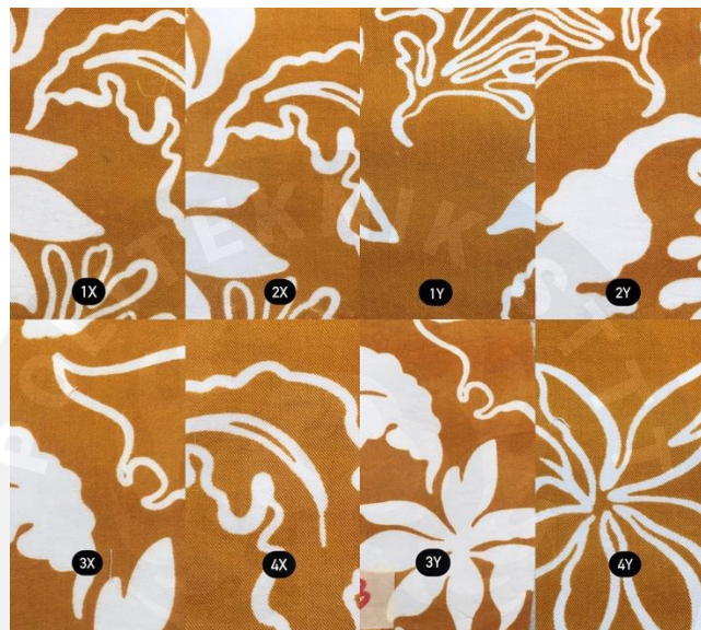
Lampiran 4 Hasil pencapan